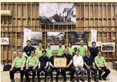
▲中津玖珠日本遺産推進協議会総会の様子

中津玖珠日本遺産推進協議会の、日本遺産「やばけい遊覧～大地に描いた山水絵巻の道をゆく～」は、平成29年(2017年)の認定から6年が経過したことから、令和5年5月19日、文化庁による認定継続の審査が行われました。その結果、高い評価を頂き、日本遺産認定が継続されることとなりました。今後も、「やばはく」を中心とした情報発信や地域の活性化に向けて取り組んで参ります。