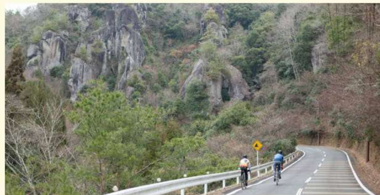
上.犬走りの景(本耶馬溪コース) / 中.バルンバルンの森(本耶馬溪コース) 下.猿の飛岩付近(マスターコース)