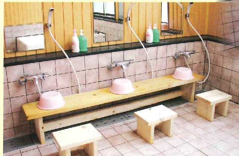
[浴室] 農業体験のあとは、炭酸泉で 心も体もリフレッシュ出来ます