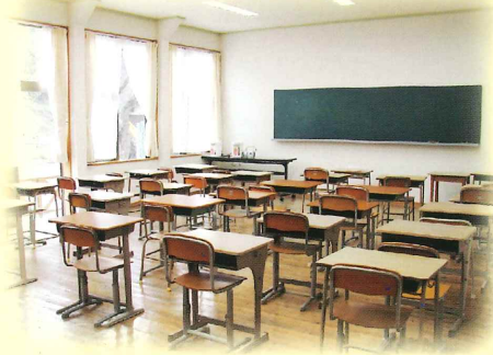
[多目的教室] 会議や研修・その他用途により ご利用下さい