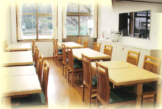
[食堂] 地元産野菜や旬の山菜を食材とした 田舎料理をご賞味ください