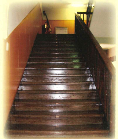
[階段] 2階へとつづく木造階段は 歴史を感じさせます