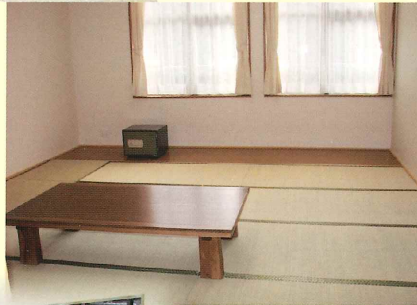
[宿泊室] 広々とした和室で くつろぎいただけます