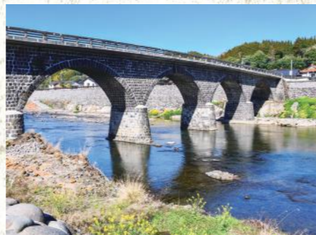
馬溪橋 MAP | P13B-2