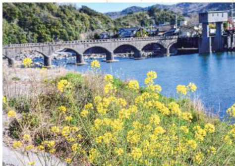
耶馬溪橋 MAP | P13C-2