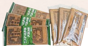
壱万円札せんべい