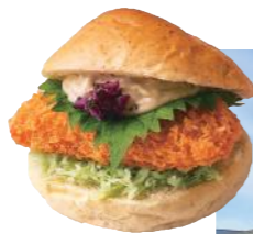
中津名物 はもカツバーガー