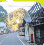
公共駐車場から展望台へ